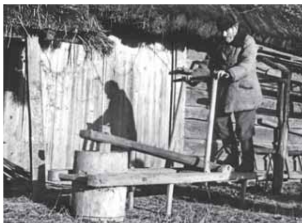
Stępa nożna, kadłubowa. Podlasie, wieś Nowo Berezowo koło Hajnówki, 1954