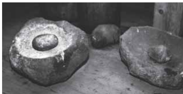
Żarna wklęsłe, nieckowate wraz z kamiennymi rozcieraczami, Muzeum Rolnictwa w Ciechanowcu, 2010