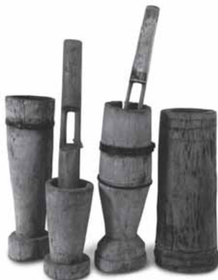
Stępy kielichowate i stępa cylindryczna (walcowata). Lubelszczyzna, okolice Chełma (wg A. Kokowskiego i M. Pokropka, 2005)