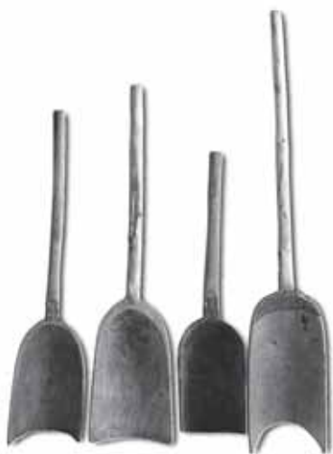
Szufle drewniane do czyszczenia (wiania, przesypywania) zboża. Lubelszczyzna, okolice Chełma (wg A. Kokowskiego i M. Pokropka, 2005)